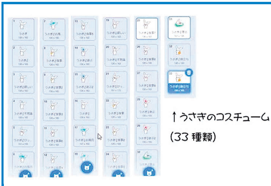
↑うさぎのコスチューム (33種類)

主人公のキャラクターが眠っているクマを起こさないように、ドーナツを食べるゲーム。「だるまさんが転んだ」からアイデアを得た。「太鼓」と「リンゴ」の二つの障害物を避けて、ドーナツ100個を食べるとクリアする。時々目を覚ますクマに見つからないように操作するテクニックが必要で、高難度のゲームに仕上がっている。